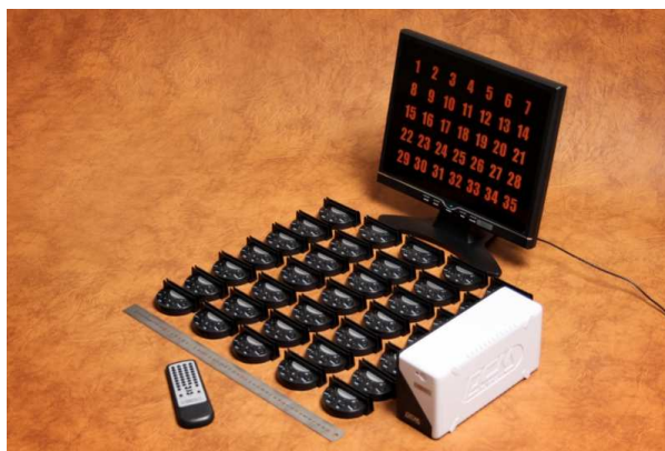
1. attēls. CS-1 komplekts līdz 35 galdiņiem.

Klienta vēlme pēc konsoles pogu piespiešanas tiek attēlota monitora ekrānā, kas atrodas apkalpotāju apmeklētākajā un redzamākajā vietā. Ekrānā iedegas klienta galda numurs. Atkarībā no tā, kuru no trijām pirmajām konsoles pogām clients piespiež, ekrānā iedegas sarkans, oranžs vai zaļš mirgojošs numurs (sk. krāsu skaidrojumu un to saistību ar noteiktu pakalpojumu tālākajā tekstā). Konsoļē uz klienta galda ir četras pogas. Ceturtā jeb vistālāk labajā pusē esošā poga ļauj atcelt apkalpotāja izsaukumu. Ja clients vienlaikus vēlas vairākus atšķirīgus pakalpojumus un piespiež vairākas konsoles pogas, numurs ekrānā sāk mirgot attiecīgajās krāsās.