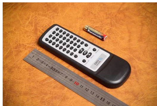
Рисунок 5. Пульт дистанционного управления.