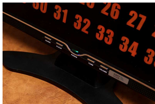
Рисунок 6. Кнопки на мониторе.