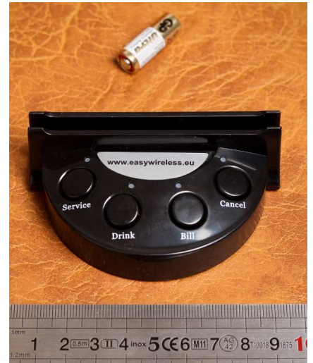
Рисунок 7. Консоль

CS-1 состоит из следующих компонентов: монитор (2 шт), пульт управления монитором (2 шт), батарейки AAA (4 шт), консоли с кнопками (80 шт), батарейки 12В 23А (80 шт), ИБП (2 шт), настенное крепление для монитора (2 шт), держатели для рекламы из прозрачного пластика (80 шт), наклейки с инструкциями (80 шт), инструкция по эксплуатации (3 шт), инструкция по эксплуатации для посетителя (80 шт), отвертка (1 шт), чемодан для транспортировки (2 шт).