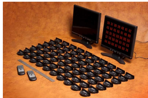
Рисунок 1. Комплект CS-2 на количество столов до 70.

После нажатия кнопки пожелание клиента отображается на экране монитора, который находится в наиболее удобном и хорошо видимом для обслуживающего персонала месте. На экране загорается номер столика - это значит, что сидящий за ним клиент хочет, чтобы его обслужили. В зависимости от того, какую из первых трех кнопок на консоли нажал клиент, на экране загорается красная, оранжевая или зеленая мигающая цифра (см. объяснение цветов и их связь с определенной услугой ниже). Всего на консоли, установленной на каждом столе, имеется четыре кнопки. Четвертая, т.е. самая правая кнопка, дает возможность отменить вызов обслуживающего персонала. Если клиент хочет одновременно получить несколько различных услуг и нажимает несколько кнопок на консоли, цифра на экране начинает мигать соответствующими цветами.