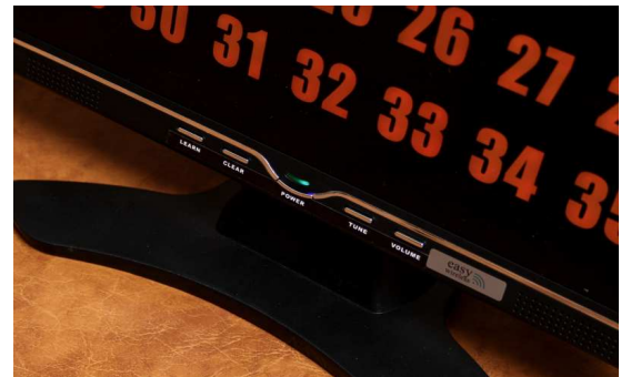
Kuva 6. Näyttöpainikkeet.