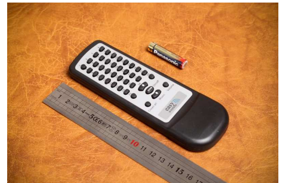
Kuva 5. Kauko-ohjauskeskus.