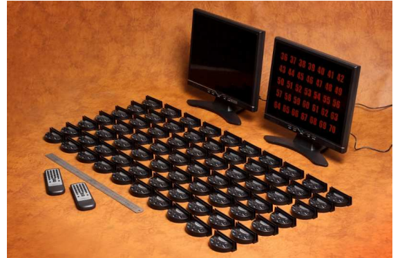
Kuva 1. CS-2 tuote enintään 70 pöytää varten.

Konsolin painikkeen painalluksen jälkeen asiakkaan kutsu ilmenee monitorinäyttöön, joka sijaitsee paikassa, jossa henkilökunta usein viipyy ja näkee sen hyvin. Näytössä syttyy palvelua hakevan asiakkaan pöytänumero. Riippuen siitä, mitä kolmesta ensimmäisestä konsolissa olevasta painikkeesta on asiakas painanut, näytössä syttyy joko punainen, oranssi tai vihreä vilkkuva numero (värien selvitys ja niiden liittyminen tiettyyn palveluun on esitetty alempana). Yhteensä asiakkaan pöydällä olevassa konsolissa on neljä painiketta. Neljäs eli oikeapuolisin painike mahdollistaa henkilökunnan kutsun perutuksen. Jos asiakas haluaa kerrallaan monta eri palvelua ja painaa monta konsolipainiketta, näytössä oleva numero alkaa vilkkua värjäytyen asianmukaiseen väriin.