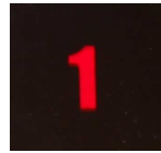
Kuva 2 Palvelu