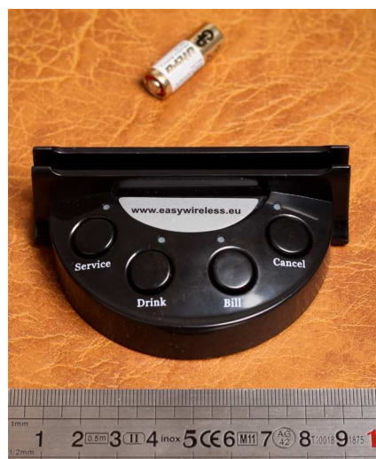
7. attēls. Konsole

CS-1 sastāv no šādām daļām: monitors (2 gab.), monitora vadības pults (2 gab.), baterijas AAA (4 gab.) konsoles ar pogām (80 gab.), 12 V baterijas 23 A (80 gab.), UPS (2 gab.), monitora sienas stiprinājums (2 gab.), caurspīdīgas plastmasas reklāmu turētāji (80 gab.), instruējošas uzlīmes (80 gab.), lietošanas instrukcija (3 gab.), lietošanas instrukcija apmeklētājiem (80 gab.), skrūvgriezis (1 gab.), transporta koferis (2 gab.).