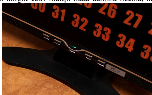
6. attēls. Monitora priekšējais panelis