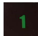
4. attēls. Rēķins