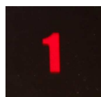
2. attēls. Apkalpošana