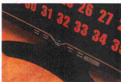
Pilt 5. Nupud monitoril.