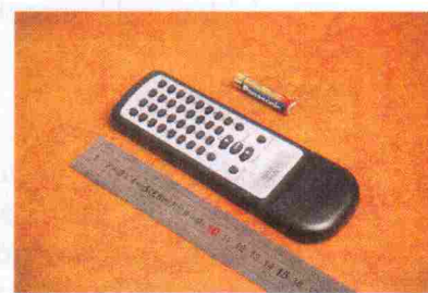
Pilt 7. Kaugjuhtimispuhast.