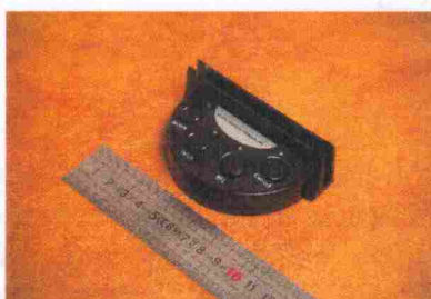
Pilt 6. Konsool