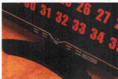
Pilt 5. Nupud monitoril.