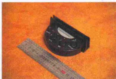
Pilt 6. Konsool