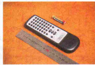
Pilt 7. Kaugjuhtimispuhvel.